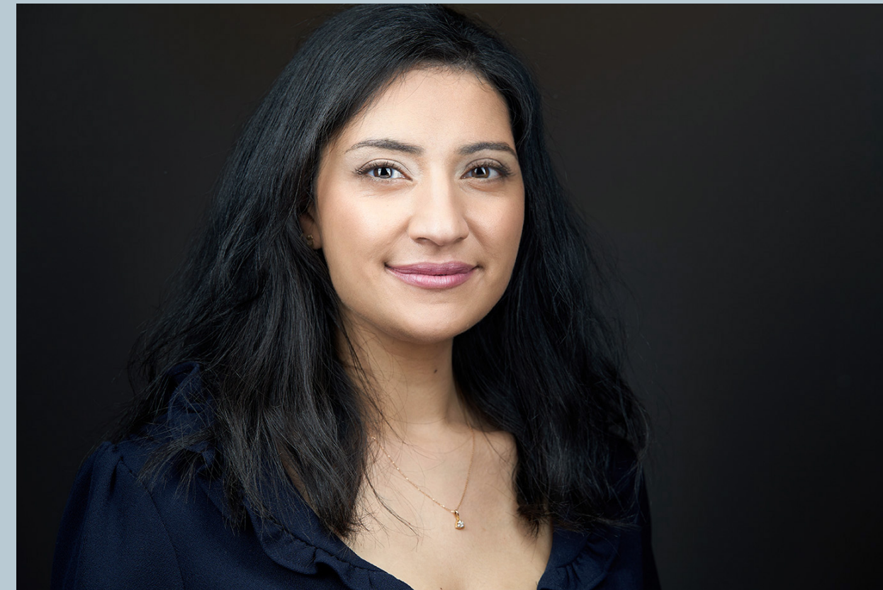
Nos techniques avancées

La photogénie est donc un mythe , en revanche, la maîtrise de la bonne technique est primordiale.